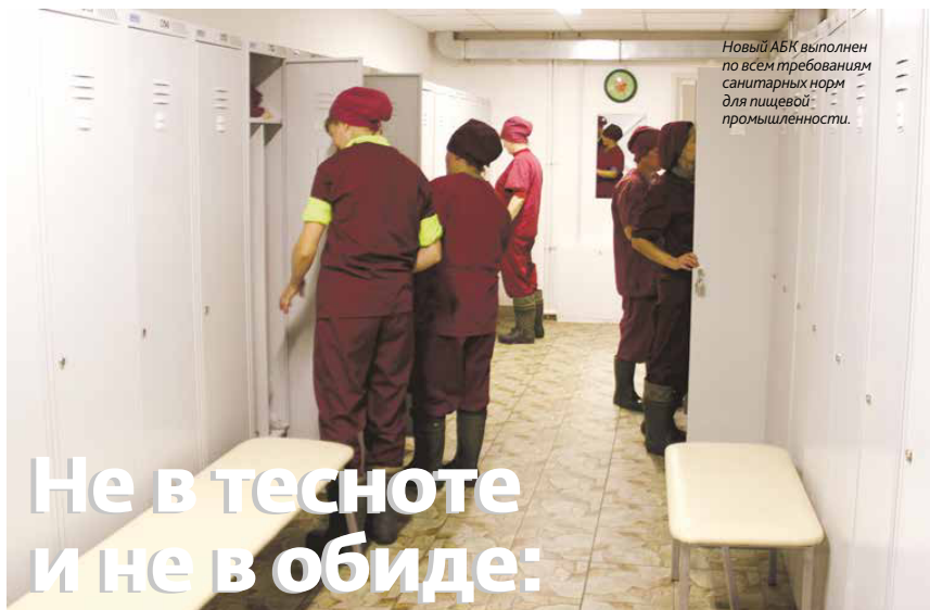
Новый АБК выполнен по всем требованиям санитарных норм для пищевой промышленности.

Новый АБК площадью около 200 «квадратов» сда-